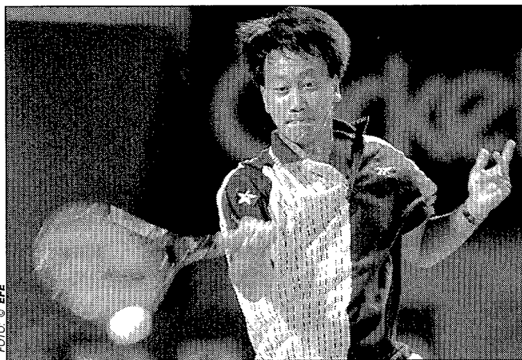
El estadounidense Michael Chang sucumbió ante la potencia de Ivanisevic

La final, sin embargo, ya tiene su protagonista: André Agassi, cla-