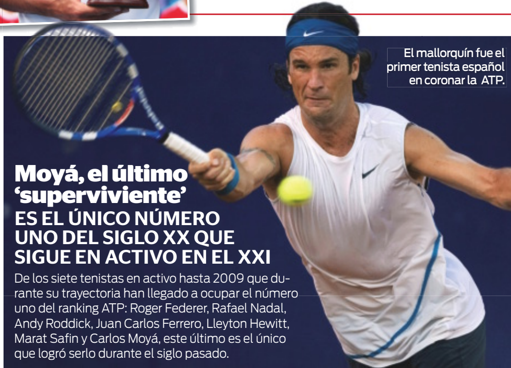
El mallorquín fue el primer tenista español en coronar la ATP.

Zimonjic no pudo ganar junto Nestor el pulso final a los hermanos Bryan, que acabaron el año liderando el ranking de dobles, pero lo que sí ha logrado es acabar como el tenista situado en el top 10 que ha llevado más dinero a sus arcas con un total de 1,203,345 $. Le sigue de cerca el canadiense Nestor con 1,111,822 $. ¿El por qué de la diferencia? Zimonjic sacó provecho de su final en el World Team Championship de Düsseldorf (torneo por naciones), donde se embolsó 65.600 €.